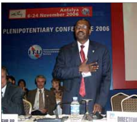
Вновь избранный Генеральный секретарь МСЭ Х. Турэ